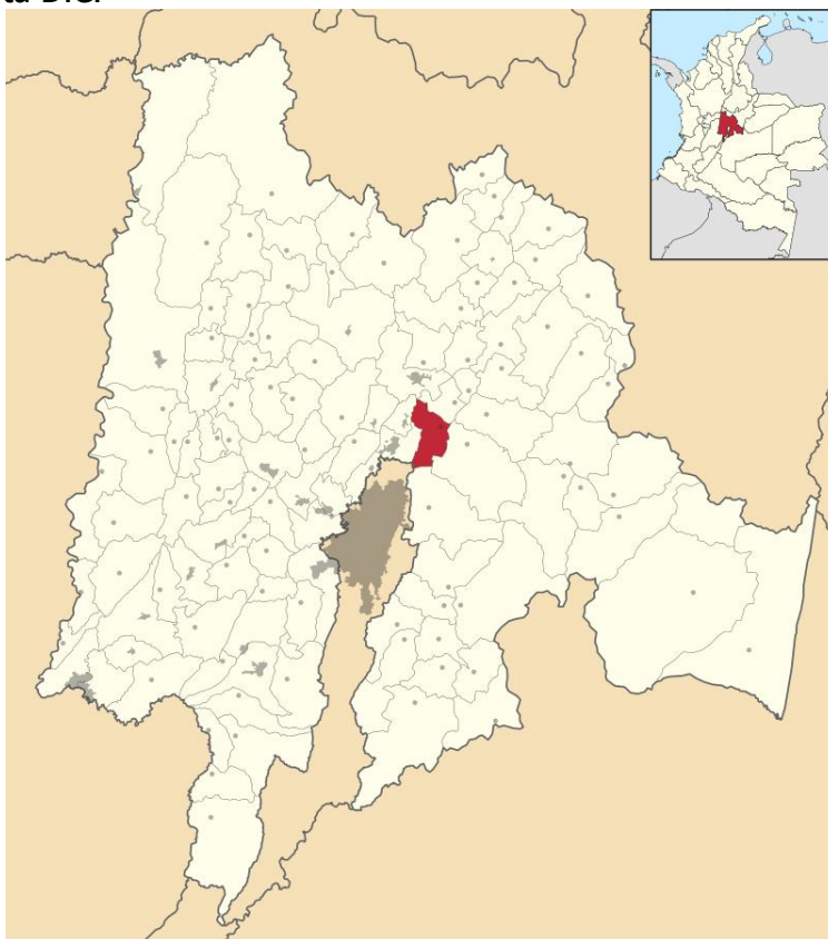
Localización del Municipio de Sopó en el contexto Nacional y en el Departamento de Cundinamarca

Ubicación: Sopó se halla situado al norte del departamento de Cundinamarca y al noreste de Bogotá D.C.