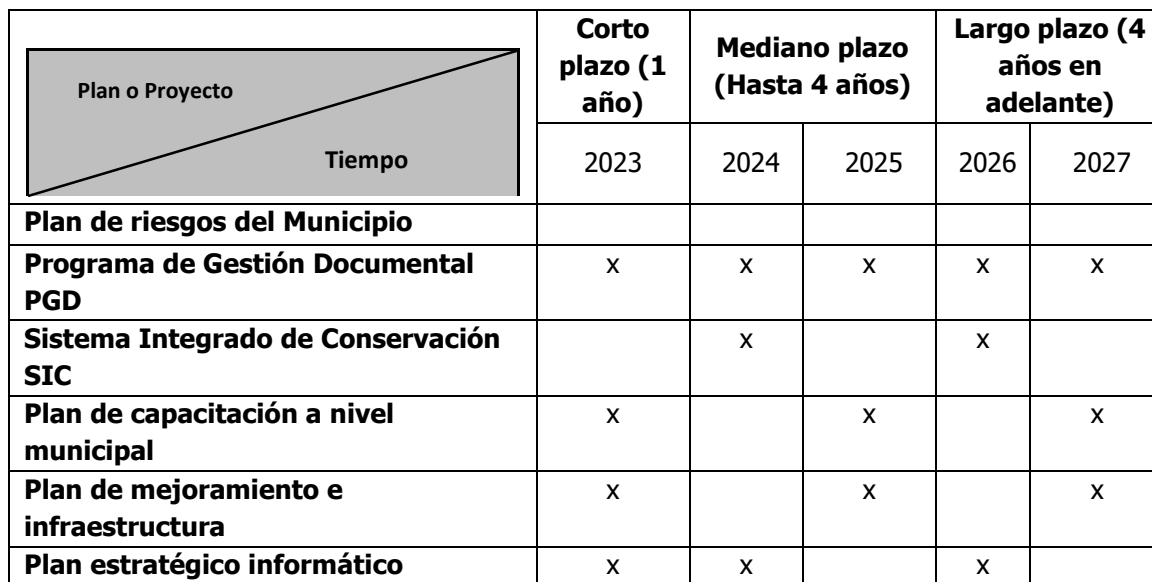
Tabla N° 8

Las presentes actividades se desarrollarán las siguientes actividades